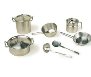
Potjes en pannetjes