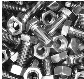
Moeren en bouten